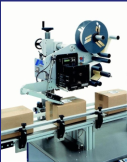
AL CODE MIT SCHWENKBARER ETIKETTEN-ANDRÜCKEINHEIT FÜR VIELE ETIKETTENFORMATE ZUR OBEN-ETIKETTIERUNG IM DURCHLAUF