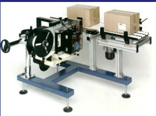
AL CODE MIT ETIKETTEN- ANDRÜCKEINHEIT MIT ANDRÜCKZYLINDER, MIT ABBLASEN DES ETIKETTS, ZUR SEITLICHEN ETIKETTIERUNG IM DURCHLAUF