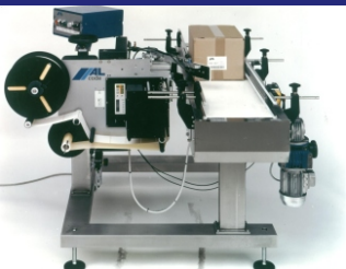
AL CODE MIT ROTIERENDER ETIKETTEN- ANDRÜCKEINHEIT, ZUR STIRNSEITIGEN ETIKETTIERUNG IM DURCHLAUF