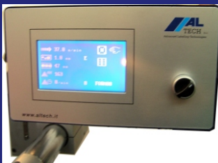
MIKRO PROZESSOR STEUERUNG MIT TOUCH-SCREEN