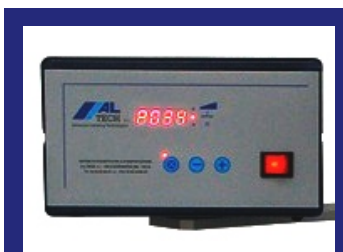
MIKRO PROZESSOR STEUERUNG